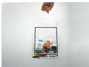
トートバッグ ¥4,800 (価格は全て税別)

詳細は決定次第順次 SOUNDS GOOD®の SNS 等にてお知らせいたします。