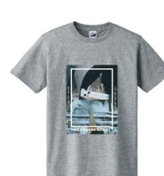
T シャツ ¥4,200